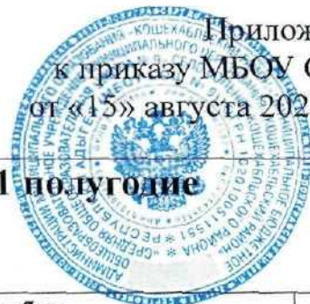
График проведения оценочных процедур в 2-11 классах на 1 полугодие 2022-2023 учебного года В МБОУ СОШ №9

Приложение №1 к приказу МБОУ СОШ №9 от «15» августа 2022г., №111