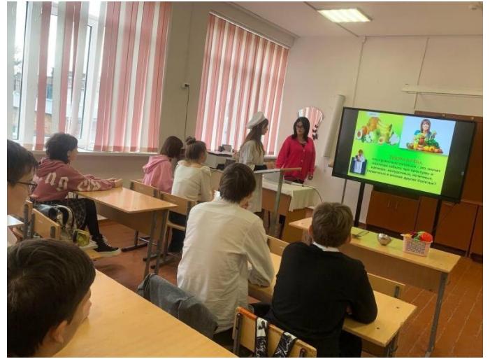
Урок-презентация в 10 классе